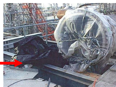
4月: 緊急時 対応