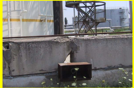
6月—タンクの防油堤に開いた穴

2010年4月、5月、6月に発行されたPSBの各号に共通していることは何か読者はお分かりだろうか？ それは全部が、一般に 受動的 なタイプと言われている安全設備を話題にしているということである。受動的安全設備は、それらの保護安全機能を働かせるために危険な状況を検出する必要がなく、また、いかなる動作を行う必要もなく、センサーや可動部を持っていない。それらは、構造—例えば、断熱材や耐火材の断熱特性と厚み、または、ダイクの壁の高さと不浸透材料—がそういう役割を果たしているのである。