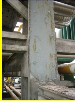
5月—配管ブリッジの支柱の破損した耐火施工