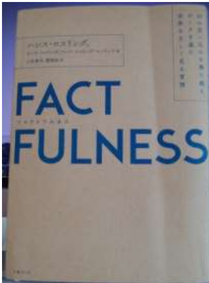
図1 FACT FULNESS

最近、図1に示す著書(Rosling et al.(2018) 1) を読んだ。原題はこの図にも示すように”FACT FULNESS”である。英語辞書には”Factful”という言葉はない。一方、翻訳書の「訳者あとがき」には、「ファクトフルな世界の見方、つまり『ファクトフルネス』につながります」とある。おそらく、「ファクトフル」という原語にもない訳語が使われるのは、この著書が初めてなのではなかろうか。そして、この原著者は「医者」である。