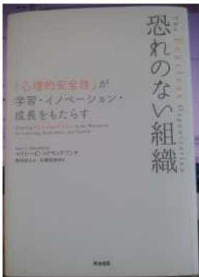
図 4 恐れのない組織

一方、「心理的安全性が学習・イノベーション・成長をももたらす『恐れのない組織』』という著書 (Edmondson (2019) 4 ) も、ほぼ同時期に発刊されている。