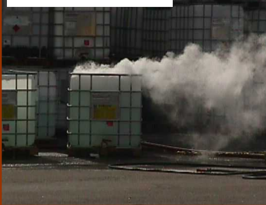
1月 - 経時変化性薬品