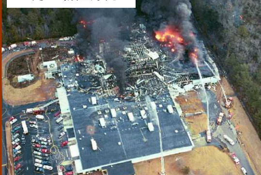
5月 - 粉塵爆発