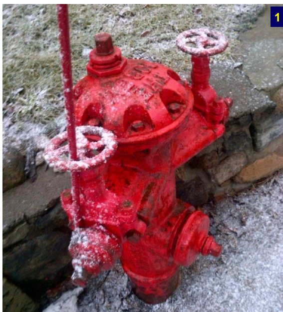
写真1は、Beacon 2004年10月号に掲載された写真3に似ている。写真3では、自然が、成長している木の枝の形によって、消火栓の操作を困難にしている。写真1では人間が消火栓バルブを通して棒と旗を取り付けており、同じ結果になっている。

明らかにこの安全手段は問題を生みだしている。金属棒はバルブハンドルの間を通して取付られている。初めにその棒を取り外さなければバルブを開けることができない! また、その棒は消火栓レンチ(スパナ)の使用に障害となる可能性がある。棒と旗は取り除くことはできるが、おそらく緊急事態においては、貴重な時間を奪うことにもなる。